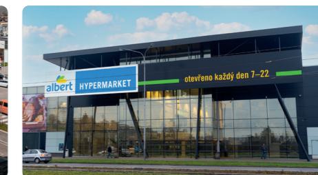
ČESKÁ REPUBLIKA, OSTRAVA

Wault: 5,1 let Pronajímatelná plocha: 13.076 m 2