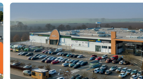
ČESKÁ REPUBLIKA, HRADEC KRÁLOVÉ

Wault: 5,4 let Pronajímatelná plocha: 12.471 m 2