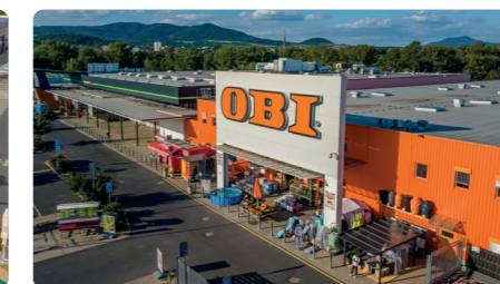
ČESKÁ REPUBLIKA, LITOMĚŘICE

Wault: 4,5 let Pronajímatelná plocha: 4.525 m 2